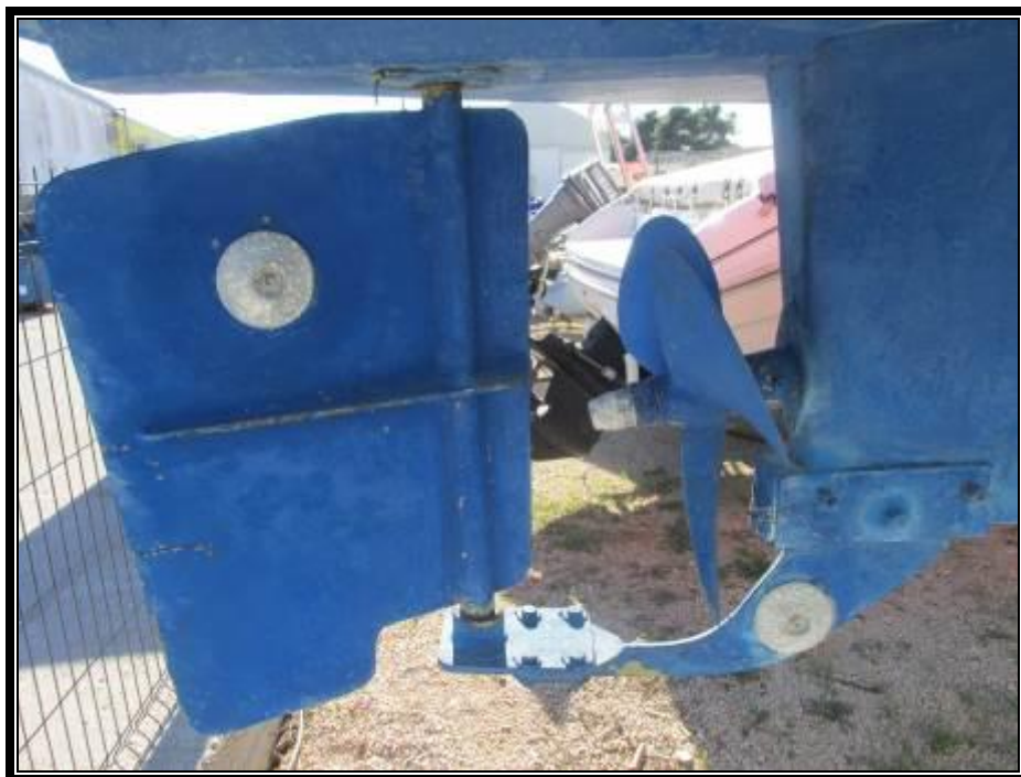
Slika 7. Kormilo i pogonski propeler