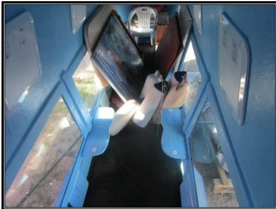
Slika 13. Unutrašnjost trupa za smještaj 12 putnika