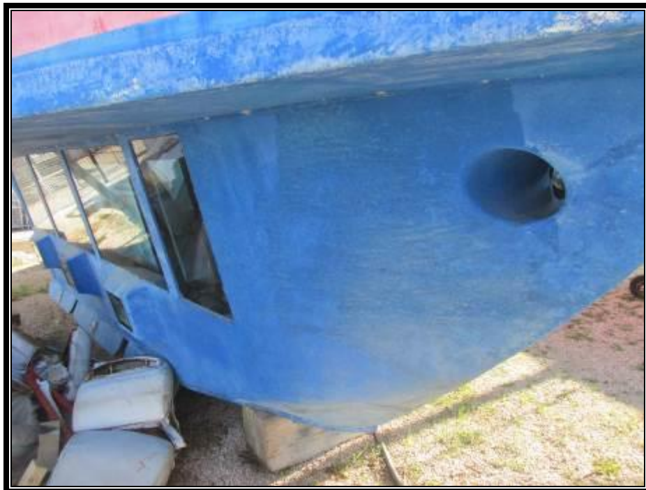
Slika 5. Podvodni dio trupa