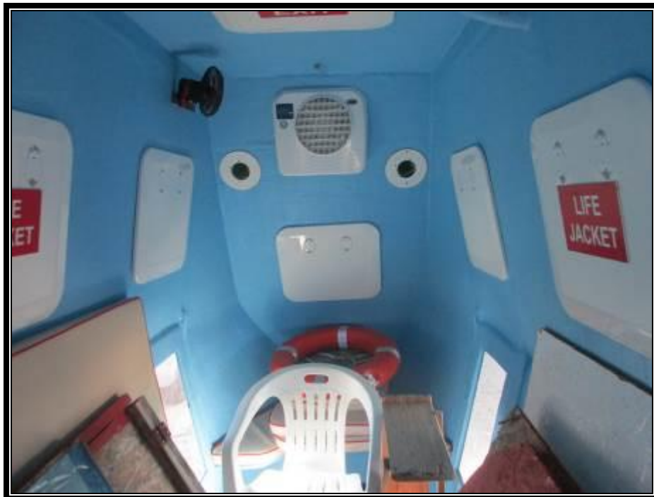
Slika 15. Klimatizacijski uređaj prostora za putnike