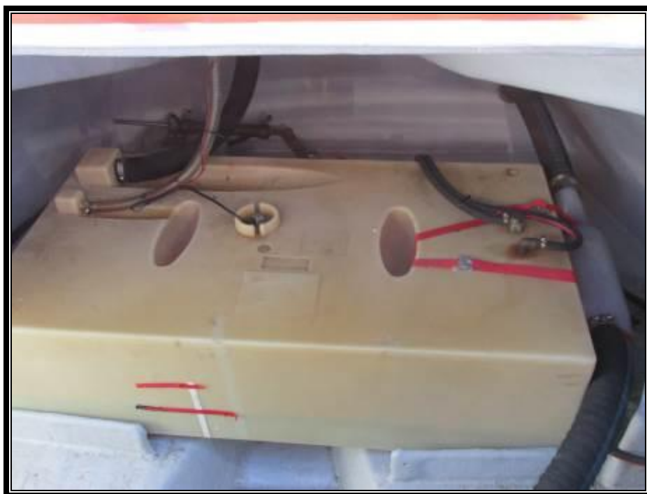
Slika 20. Rezervar nafte