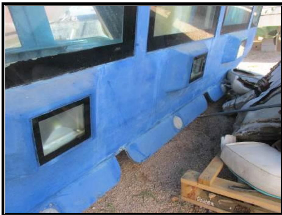
Slika 8. Podvodna rasvjeta