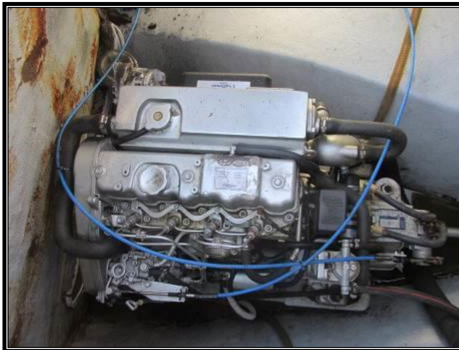
Slika 17. Pogonski motor CRAFTSMAN