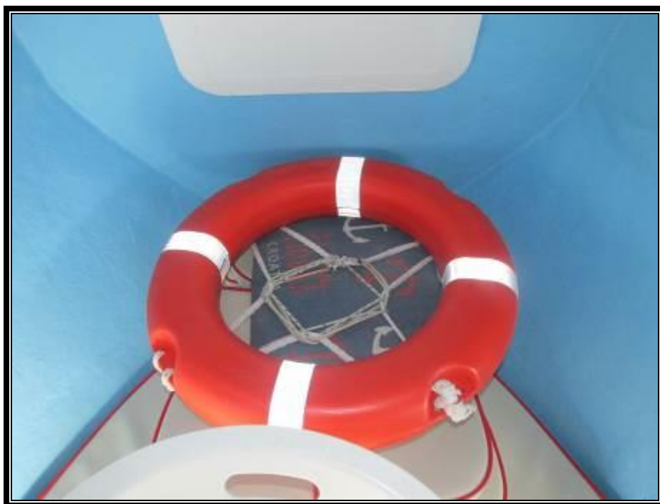
Slika 14. Obvezna oprema za spašavanje