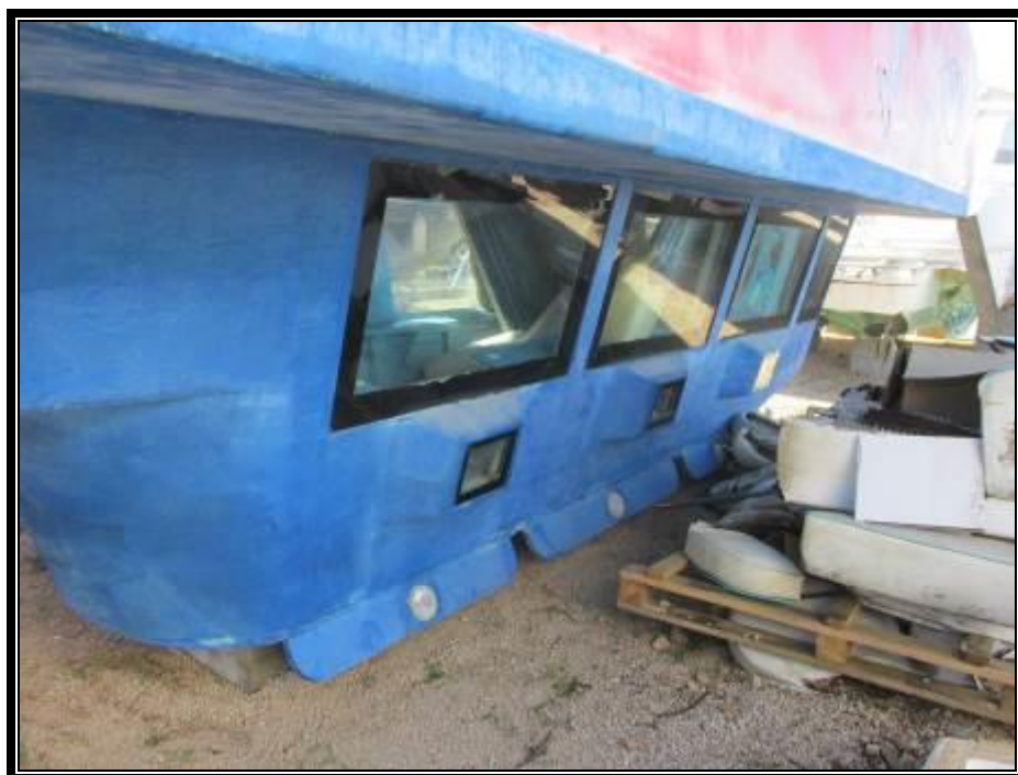
Slika 4. Podvodni dio trupa