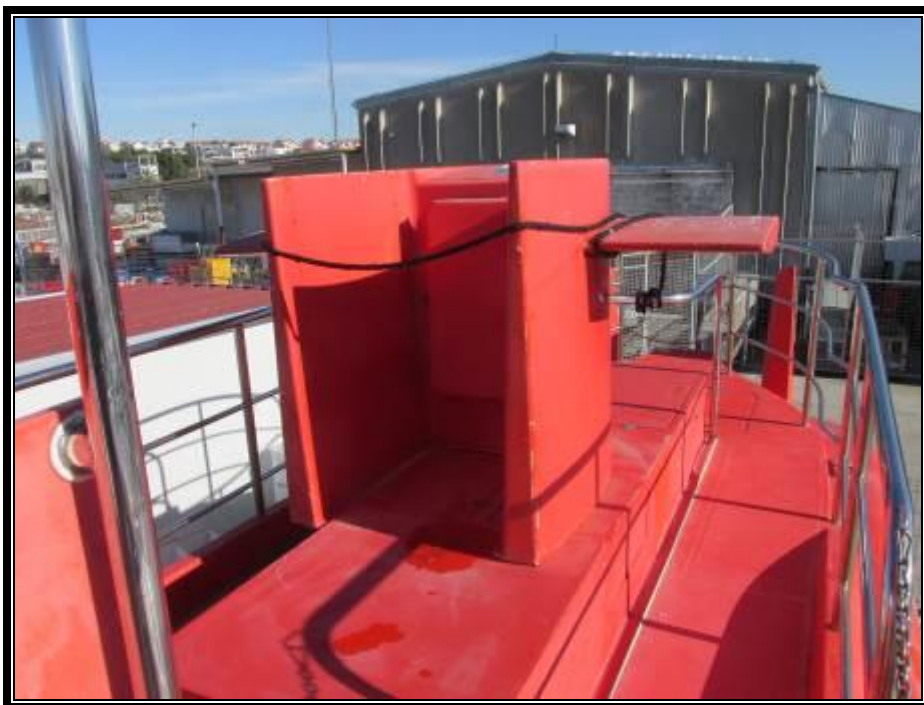
Slika 10. Paluba – središnj i krmeni dio