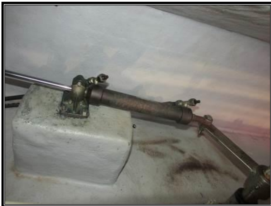
Slika 19. Kormilarski uređaj