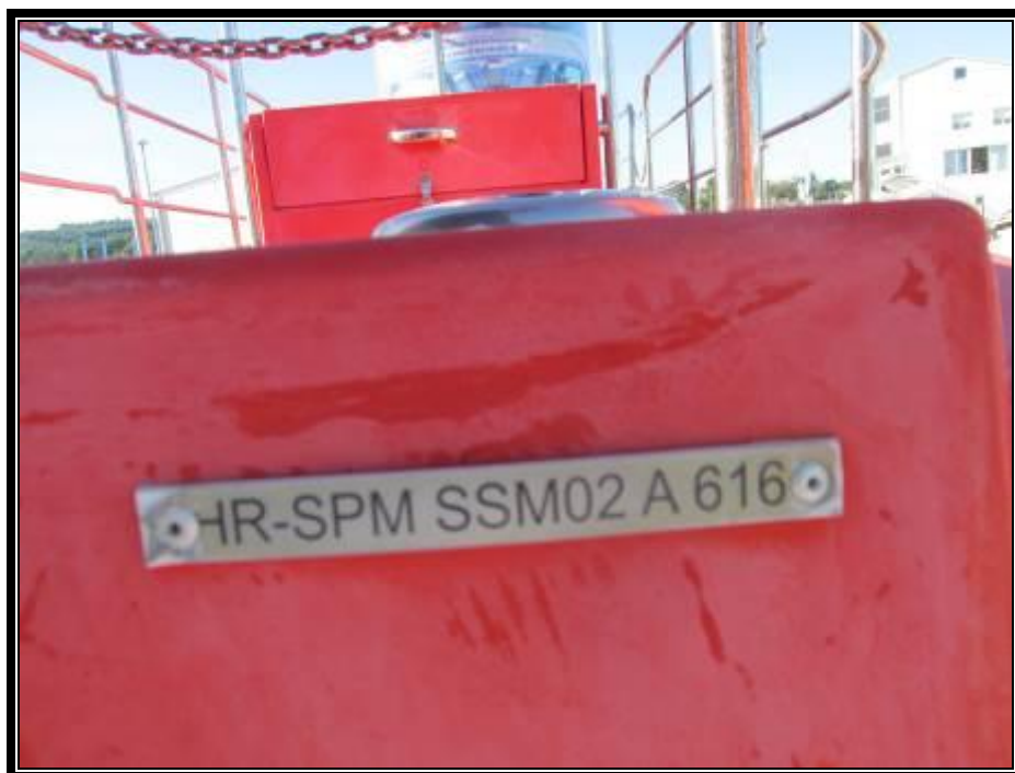
Slika 3. Identifikacijska oznaka trupa – HIN