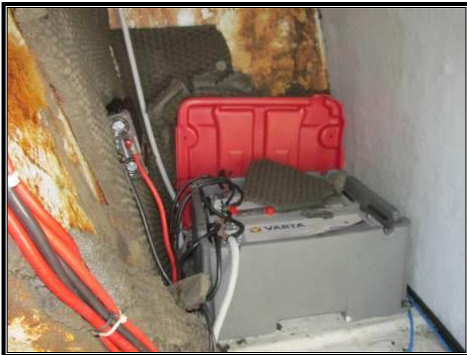
Slika 21. Ispražnjene baterije