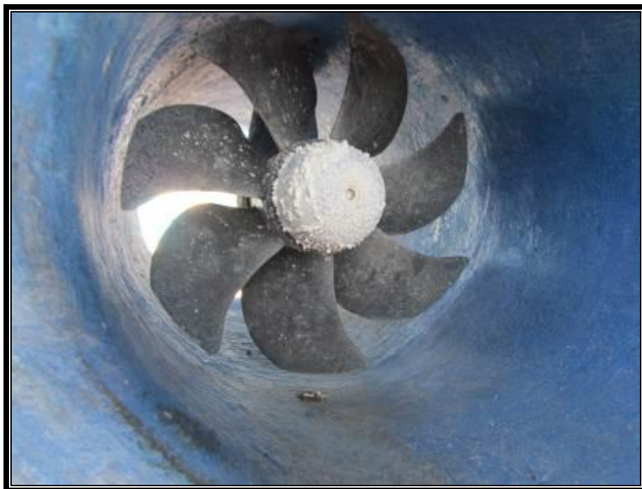
Slika 6. Pramčani potisnik