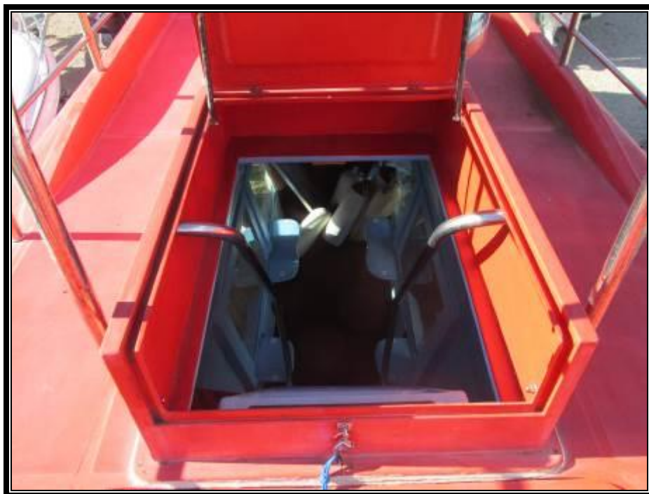
Slika 16. Ulaz u prostor za putnike