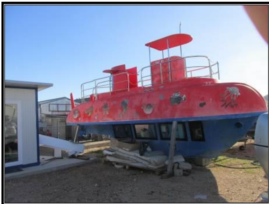
Slika 1. motorna brodica 1247 -VD