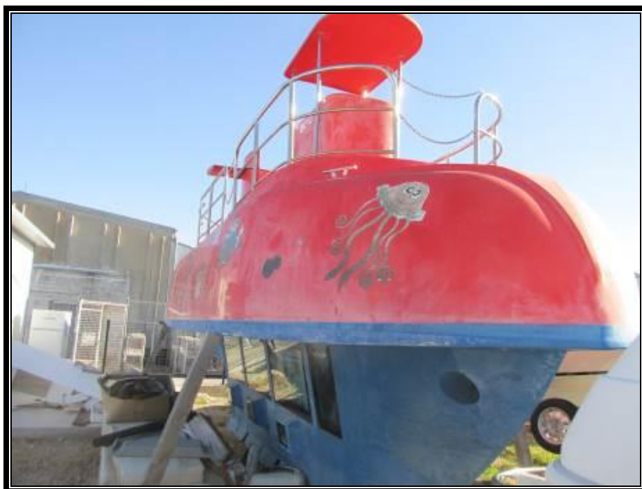
Slika 2. Pramac brodice