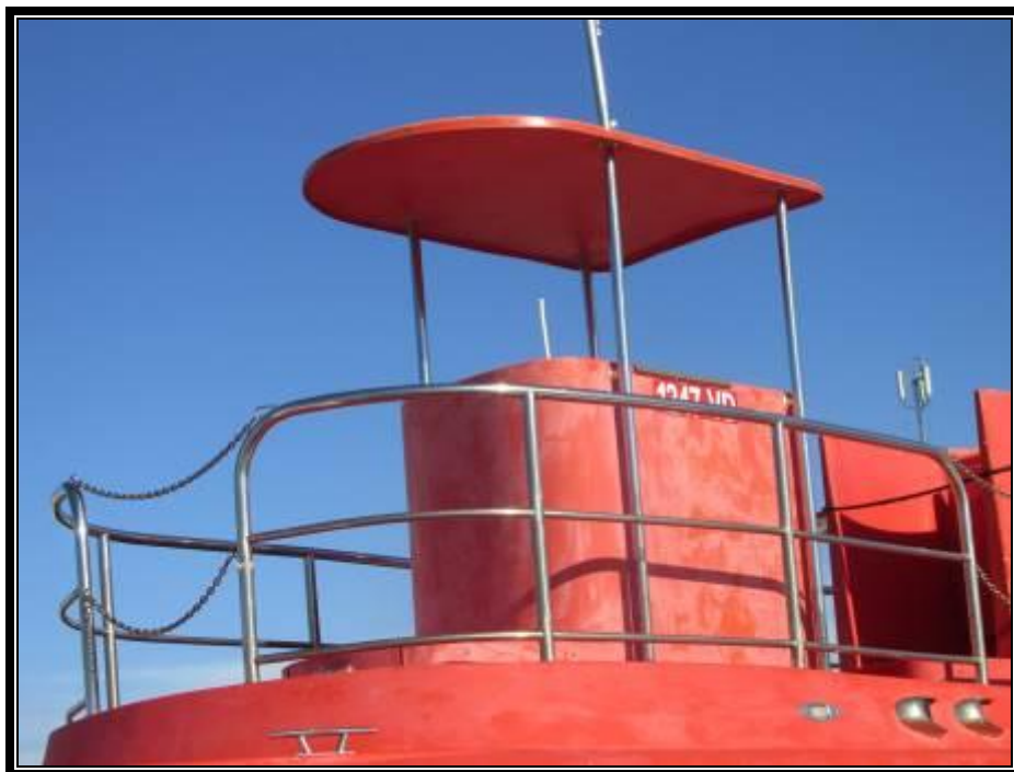
Slika 11. Kormilarnica s upravljačkim mjestom