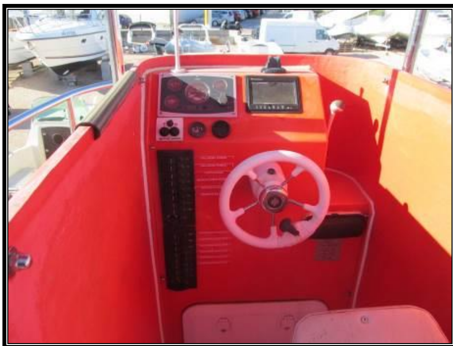
Slika 12. Kormilarsko mjesto s uređajima