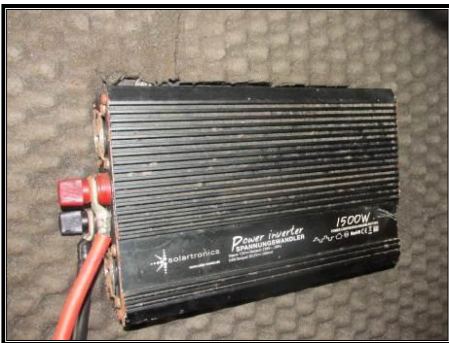
Slika 22. Inverter 12V DC – 220V AC