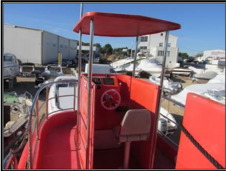
Slika 9. Paluba s kormilarskim mjestom